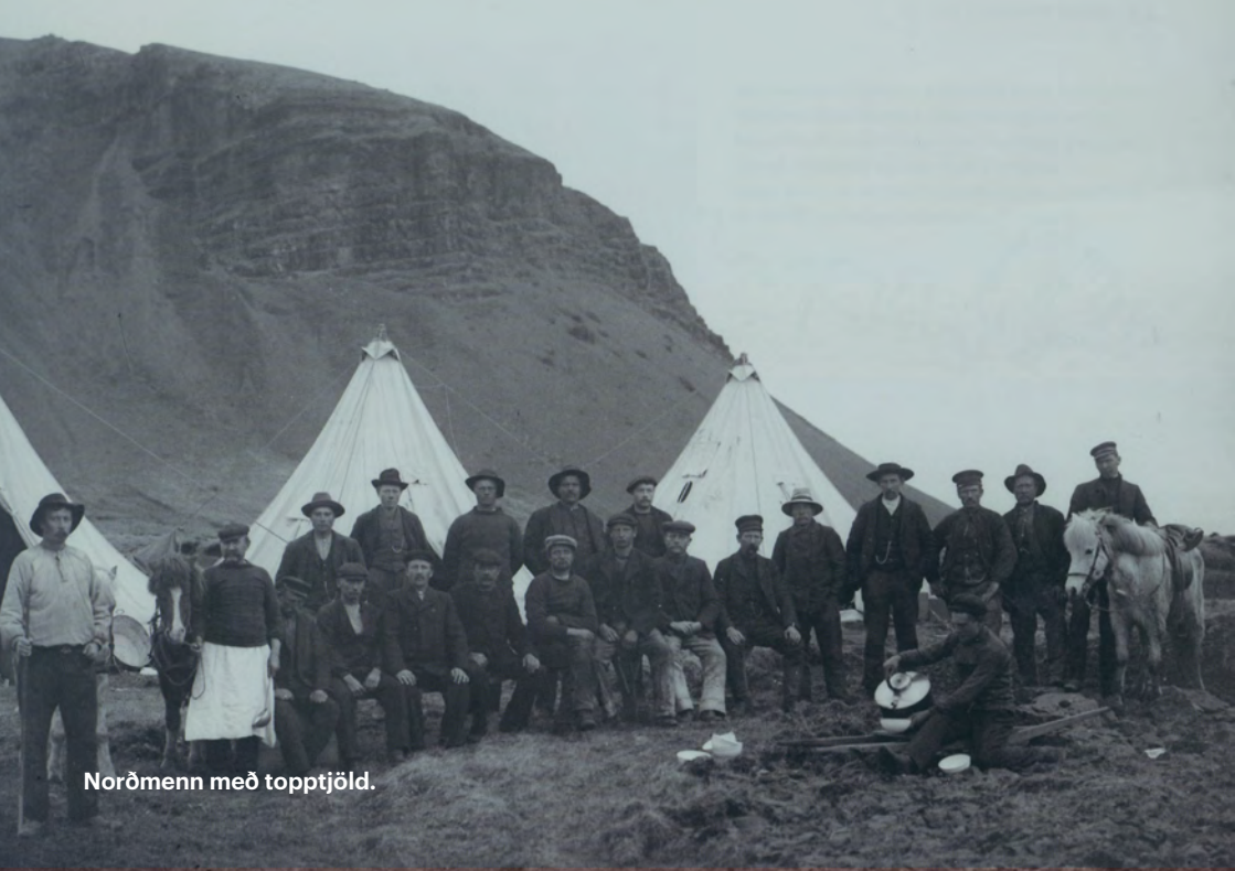
Norðmenn með toptjöld.